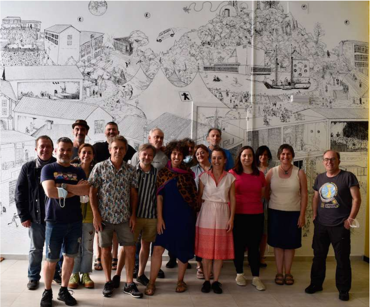
N.E.V.E.R.M.O.R.E. Equipo completo