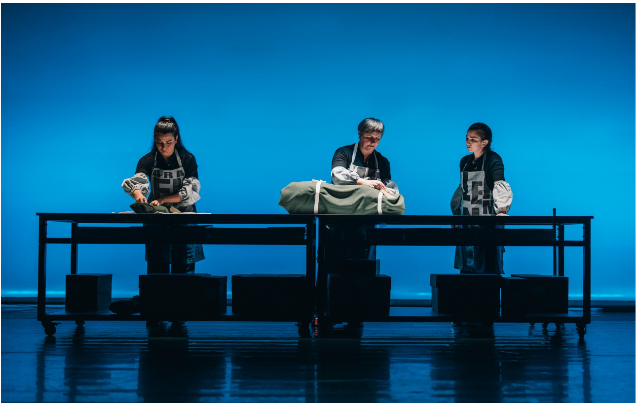
HELEN KELLER, ¿LA MUJER MARAVILLA?

Después de una serie de piezas que cuestionaron las narrativas oficiales a través de historias locales en las que se cruzan la memoria colectiva y la experiencia personal (Citizen, Eurozone, Fillas Bravas, Eroski Paraíso, Curva España, N.E.V.E.R.M.O.R.E.), este proyecto cuestiona nuestro modus operandi, con el objetivo de seguir desbordando los límites y las estrategias de las prácticas de teatro documento. Se aleja de las historias más o menos locales y de la mirada generacional, pero mantiene el interés por narrar desde las zonas de fricción entre la memoria colectiva y los relatos oficiales, usando la misma metodología de trabajo y las tácticas de creación propias.