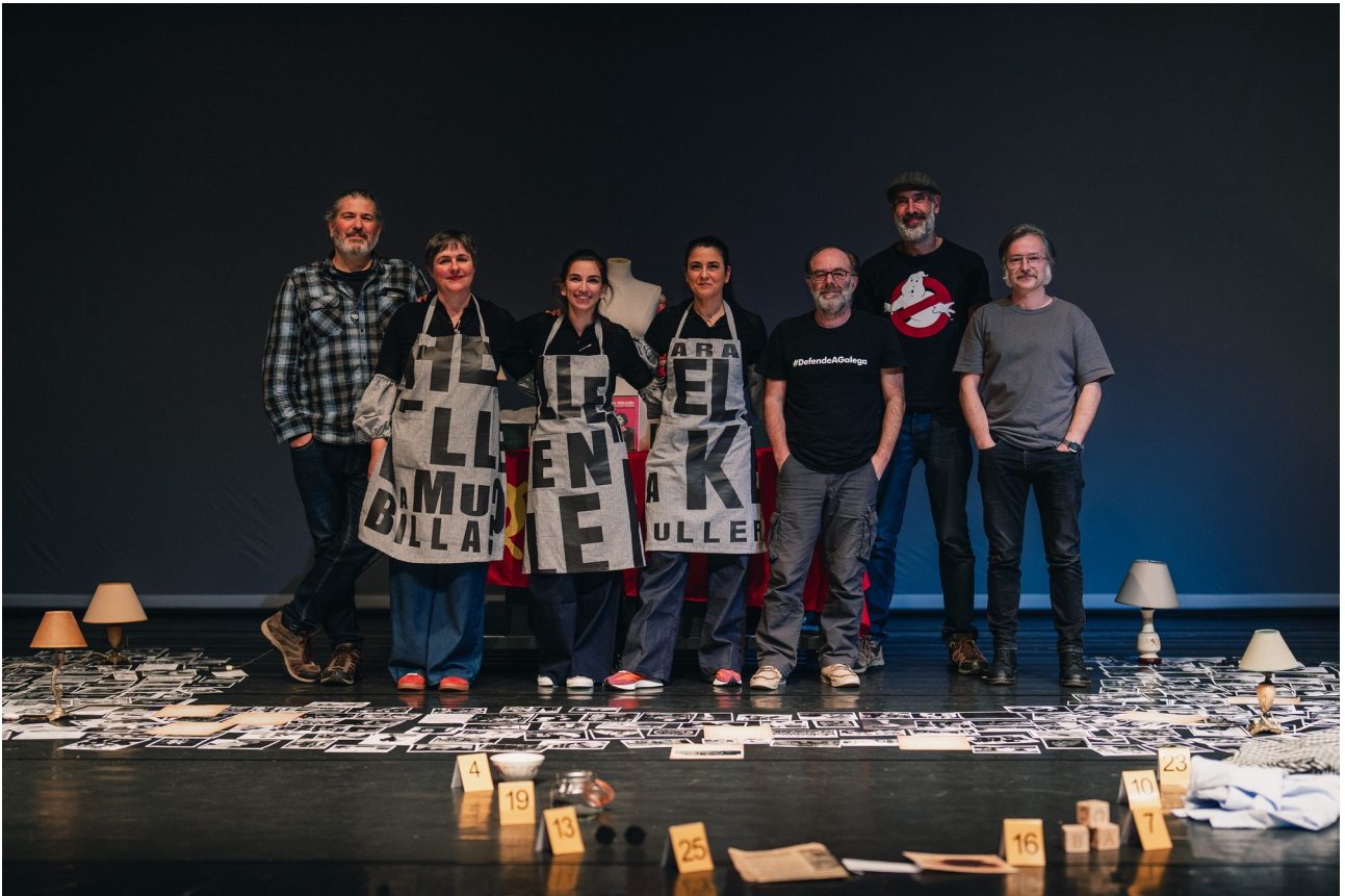
HELEN KELLER, ¿LA MUJER MARAVILLA? Parte del equipo