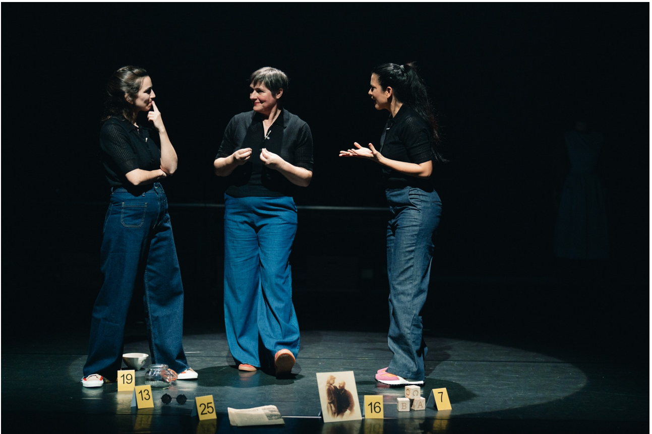
HELEN KELLER, ¿LA MUJER MARAVILLA?