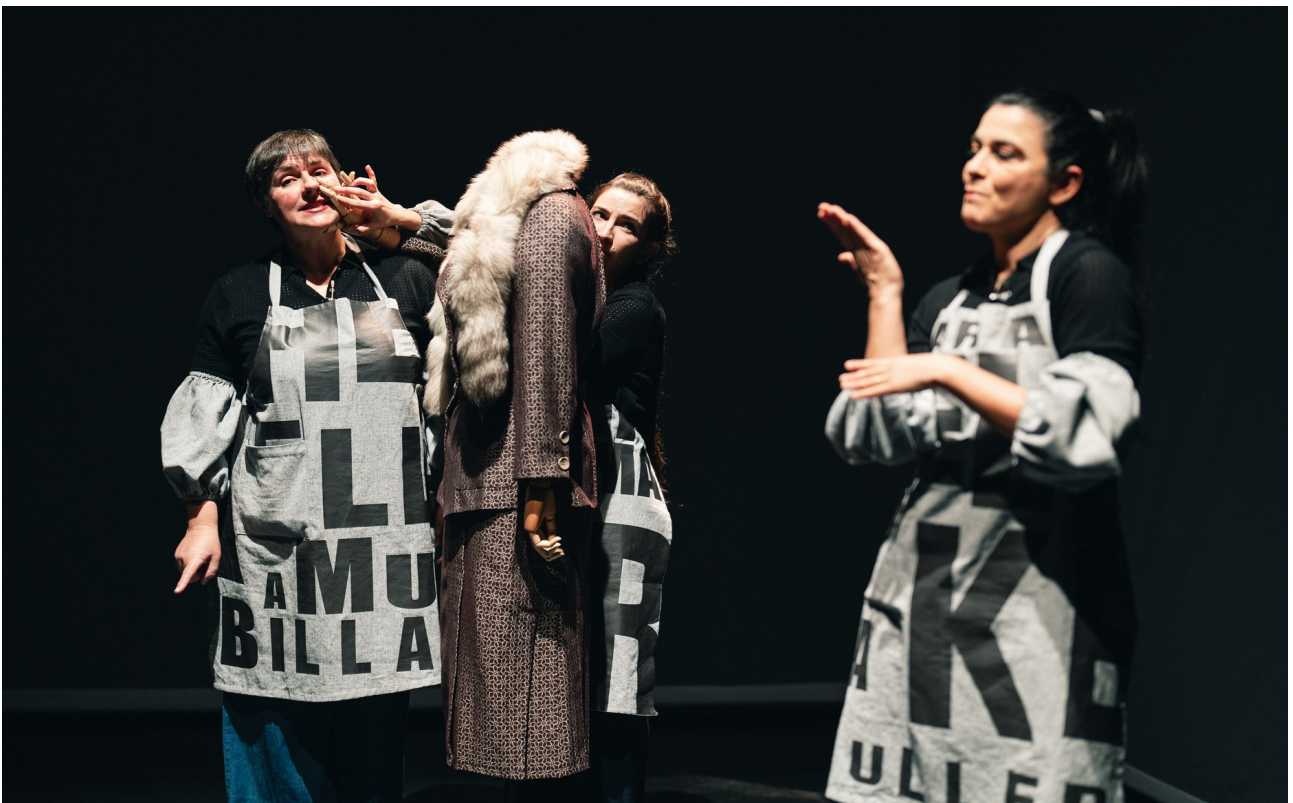
HELEN KELLER, ¿LA MUJER MARAVILLA?