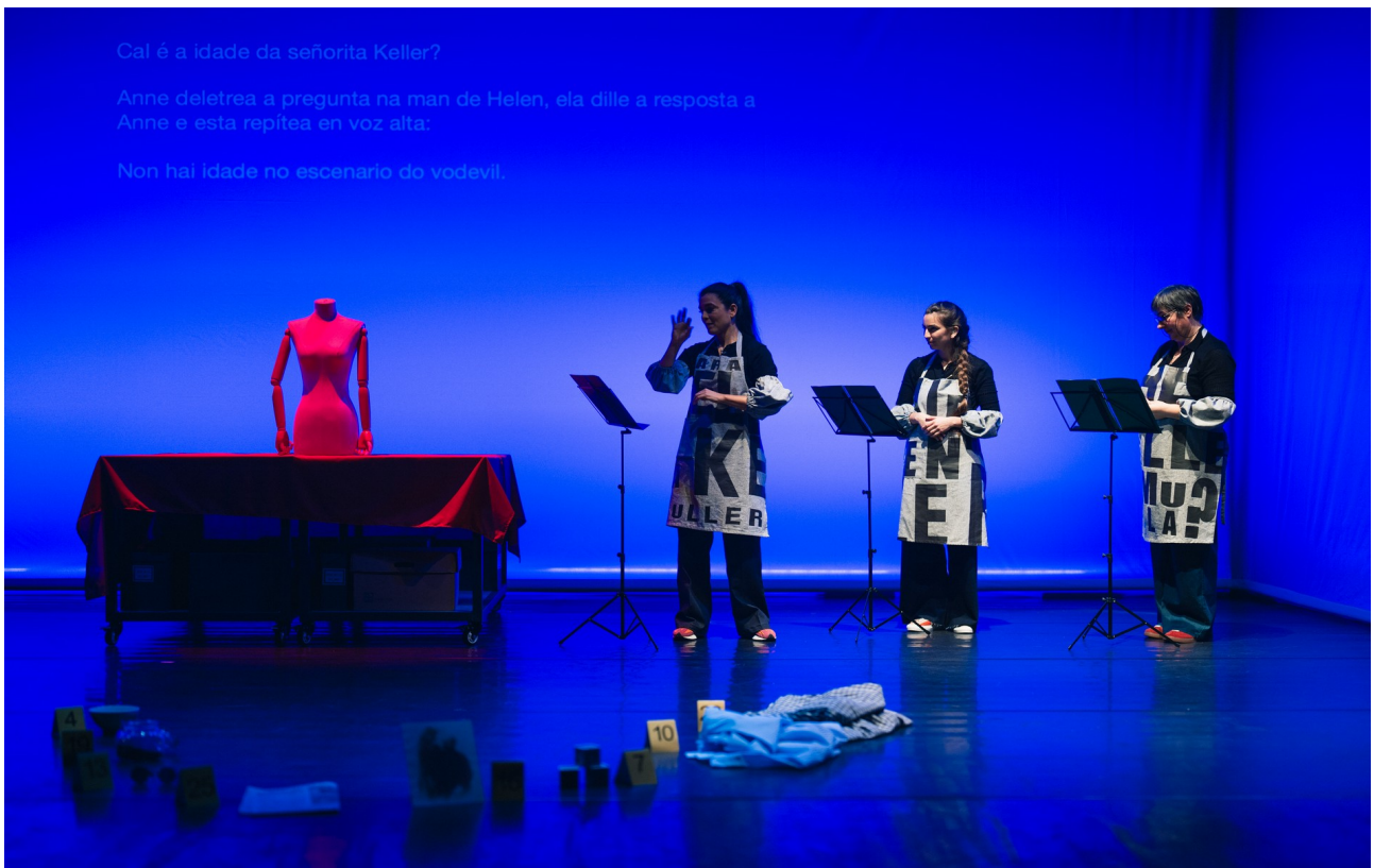
HELEN KELLER, ¿LA MUJER MARAVILLA?