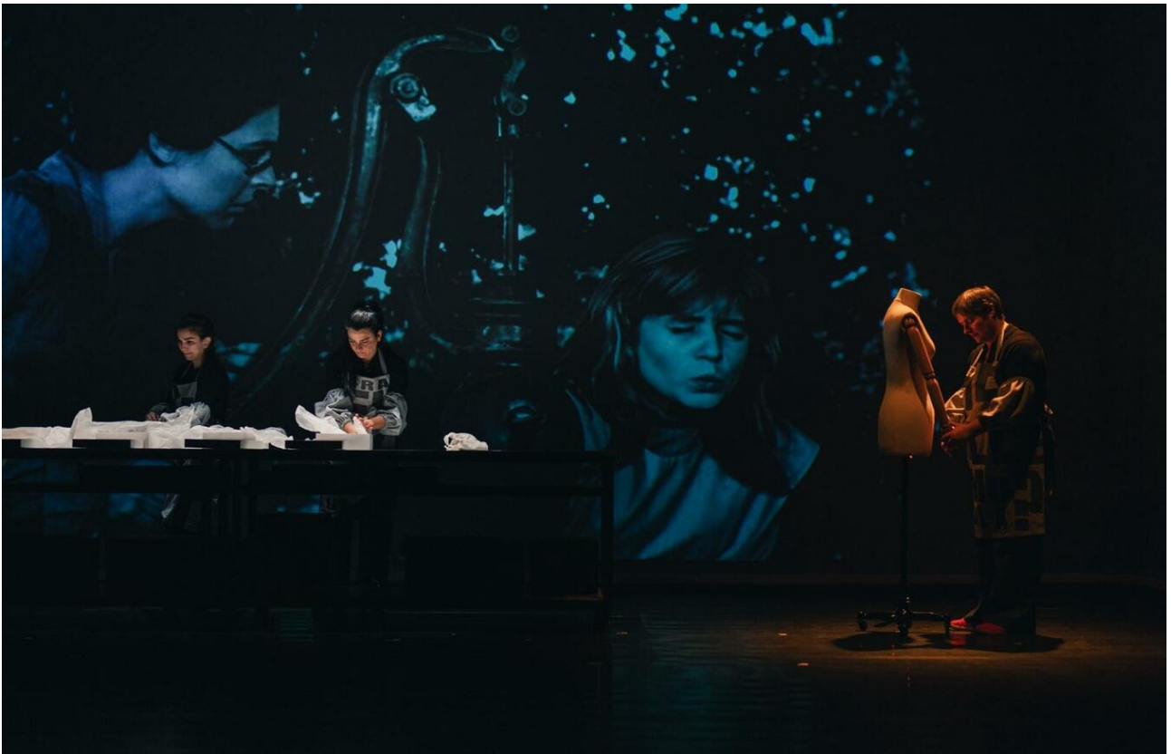
HELEN KELLER, ¿LA MUJER MARAVILLA?